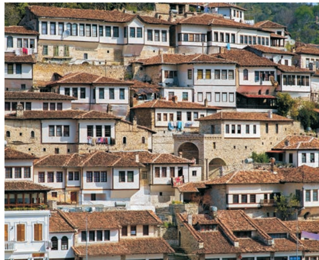
eng an die Felsen geschmiegte Altstadt von Berat

Nach langer Abgeschlossenheit wird die Region vom internationalen Tourismus erst heute so langsam entdeckt und blieb bislang von einem Massenansturm noch verschont. Großartige Landschaften mit einer nahezu unberührten Natur in den Albanischen Alpen, lange Sandstrände an der Adria und eine abwechslungsreiche Geschichte bis zurück in die Antike - Albanien hat dem Reisenden viel zu bieten. Auf unserer Route warten allein 5 UNESCO-Welterbestätten (und 3 Anwärter darauf) auf Ihren Besuch. Mit einem albanischen Geographen, der seine Heimat bis in den abgelegensten Winkel kennt, hervorragendes Deutsch spricht und humorvoll die Eigenheiten der Region vermittelt, wird diese Reise zu einem ganz besonderen Erlebnis. Mit einer kleinen Gruppe von max. 16 Teilnehmern gastieren Sie in hochwertigen Hotels sowie Landgasthöfen und genießen die ausgezeichnete lokale Küche. Sehr schnell wird Sie die herzliche Gastfreundschaft und lebensfrohe Art der Albaner begeistern und eventuelle Vorurteile als vollkommen unberechtigt verpuffen lassen. Die gesamte Region gilt heute als äußerst sicher. Die Route führt von der farbenprächtigen Hauptstadt Tirana über Krujë und Shkodra nach Montenegro, in den Biogradska Gora Nationalpark sowie über Peja und Prizren in die Albanischen Alpen. In Südalbanien führt die Route nach Berat, entlang der Adria bis nach Butrint sowie über Gjirokastra nach Ohrid in Nordmazedonien. Ihren Abschluss findet die abwechslungsreiche Reise in der Hafenstadt Durrës an der Adria.