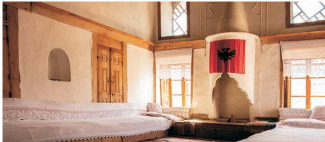
Wohnraum in einem traditionellen Bürgerhaus in Gjirokastra

Nach der Anmeldung zu dieser Exkursion wird mit der von GEOPULS zugesandten Buchungsbestätigung eine Anzahlung (15 % des Reisepreises) fällig. Die Restzahlung erfolgt zwei Wochen vor Reisebeginn. Es gelten die Geschäftsbedingungen des Veranstalters: Geopuls GbR, Neckarhalde 62, 72108 Rottenburg (Tel. 07472-9808802). Bitte beachten Sie vor Reisebuchung unsere Allgemeinen Reisebedingungen sowie das Formblatt zur Unterrichtung des Reisenden bei einer Pauschalreise nach § 651a des BGB (EU-Richtlinie 2015/2302). Beides schicken wir vor Buchung gerne zu, oder kann auf/von der Webseite www.geopuls.de eingesehen und ausgedruckt werden.