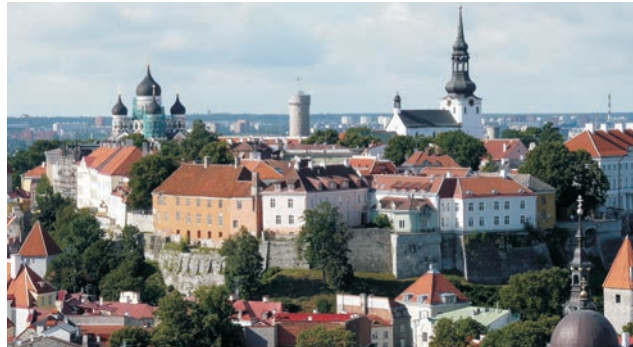
Estland: Oberstadt mit Alexander-Newski-Kathedrale in Tallinn