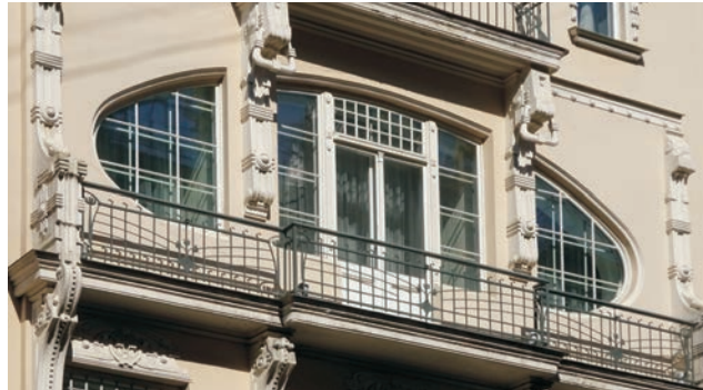
Lettland: Fenster im Jugendstilviertel von Riga

Die waldreichen und von Moränen der letzten Eiszeit geprägten, äußerst reizvollen, seenreichen Landschaften sind recht dünn besiedelt. Hier trifft der Reisende auf trutzige Burgen, prächtige Schlösser und idyllische Dörfer. Die glanzvollen Städte hingegen, die auf Jahrhunderte abwechslungsreicher Geschichte zurück blicken, waren bedeutende Handelsstädte der einst mächtigen Hanse. Mit sehr unterschiedlichen Sprachen haben die baltischen Länder bis heute ihre eigenen Wurzeln und Identität bewahrt. Während Lettland, einst Teil des Deutschen Ordens, der Reformation zusprach, blieb Litauen katholisch während Estland enge kulturelle Verbindungen zu Finnland pflegt. Seit ihrer erneuten Unabhängigkeit 1990/ 91 und dem EU-Beitritt 2004 haben die baltischen Staaten eine beachtenswerte Entwicklung vollzogen, die sich vor allem im Straßenbild der Städte widerspiegelt. Unsere Route umfasst beides: die größeren Städte wie Vilnius, Kaunas, Klaipeda (Memel), Riga und Tallinn, verläuft aber ebenso durch die beschaulichen ländlichen Regionen (z.B. Trakai, Ostseebad Palanga, Krimulda, Turaida, Sigulda) und zu wunderschönen Landschaften (z.B. Kurische Nehrung mit ihren Dünen, oder der Gaujas Nationalpark mit imposantem Urstromtal und die Jägala-Wasserfälle östlich von Tallinn).