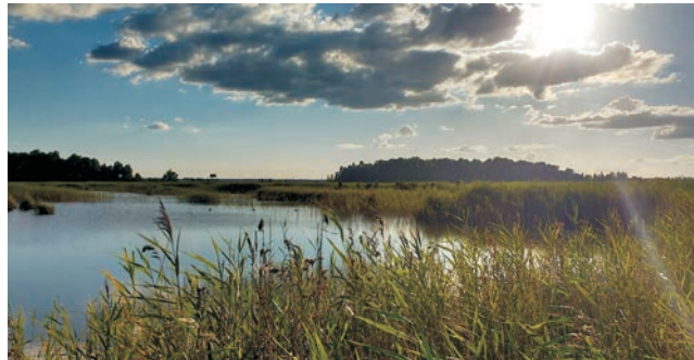
Eiszeit: einer der zahlreichen Seen in den Moränenlandschaften des Baltikums

dieser Folder wurde CO 2 -neutral hergestellt