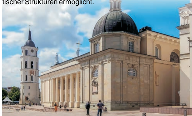
Litauen: Domplatz mit frei stehendem Glockenturm

GEOPULS wurde 2004 von Dozenten des Geographischen Instituts in Tübingen gegründet. Begeisterte Geographen, die ein Land durch Ihre Arbeit von allen Seiten kennengelernt haben, führen Sie durch Kultur und Natur des Reiseziels, wobei es, neben den touristischen Höhepunkten, immer noch etwas mehr zu sehen und zu erleben gibt. Wenig Bekanntes, tiefe Einblicke, das Erkennen von Zusammenhängen in Kultur- und Naturraum, Hintergründiges. Ausflüge in die Natur mit der einen oder anderen kleinen Wanderung gehören dazu, um auch die landschaftlichen Besonderheiten und deren Schönheit kennenzulernen und zu genießen. Die Teilnehmerzahl ist je nach Reise auf angenehme 12 bis max. 18 Personen beschränkt, was auch noch ein Reisen abseits massentouristischer Strukturen ermöglicht.