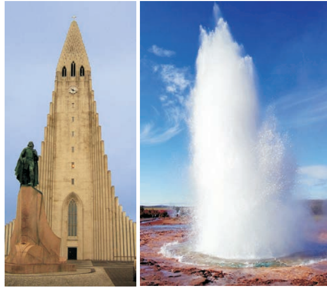
Hallgrímskirkja in Reykjavík (links) und Geysir Strokkur im Haukadalur (rechts)

dieser Folder wurde CO 2 -neutral hergestellt