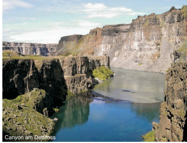
Canyon am Dettifoss

Nach der Anmeldung zu dieser Exkursion wird mit der von GEOPULS zugesandten Buchungsbestätigung eine Anzahlung (15 % des Reisepreises) fällig. Die Restzahlung erfolgt zwei Wochen vor Reisebeginn. Es gelten die Geschäftsbedingungen des Veranstalters: Geopuls GbR, Neckarhalde 62, 72108 Rottenburg (Tel. 07472-9808802). Bitte beachten Sie vor Reisebuchung unsere Allgemeinen Reisebedingungen sowie das Formblatt zur Unterrichtung des Reisenden bei einer Pauschalreise nach § 651a des BGB (EU-Richtlinie 2015/2302). Beides schicken wir vor Buchung gerne zu, oder kann auf/von der Webseite www.geopuls.de eingesehen und ausgedruckt werden.