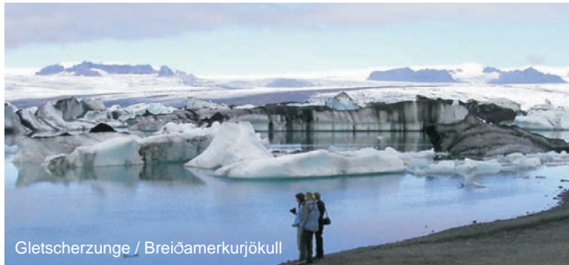
Gletscherzunge / Breiðamerkurjökull

* abhängig vom Wechselkurs und event. Flugpreisänderungen